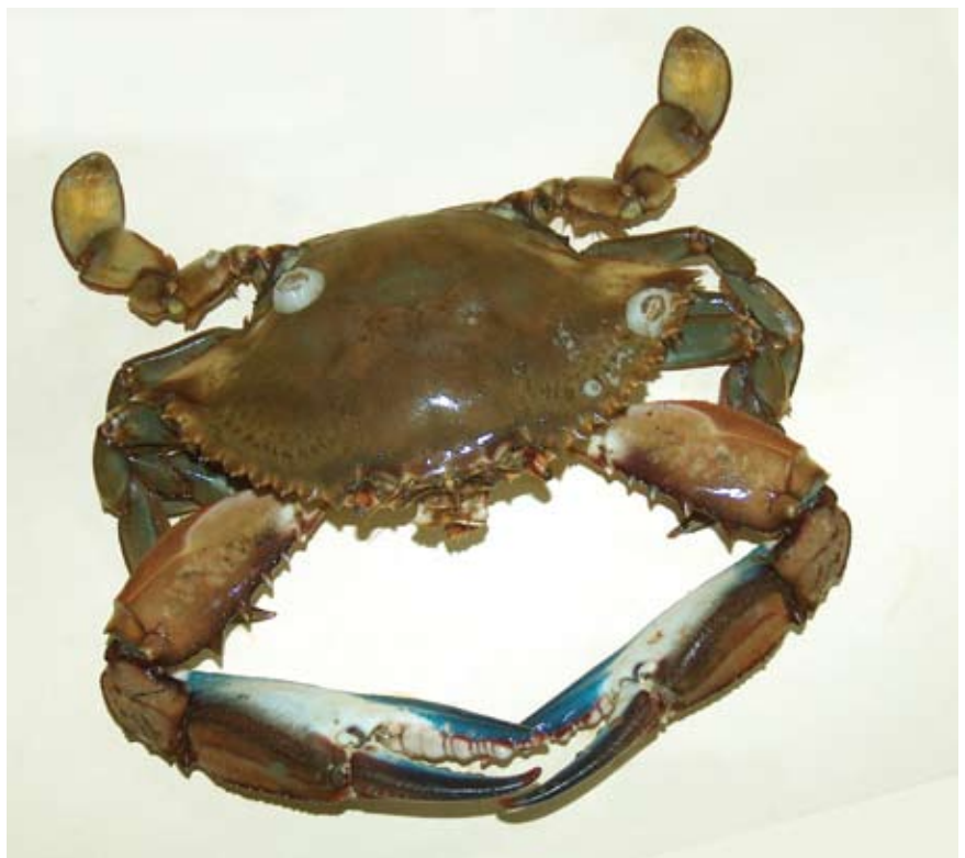
Figura 1. Ejemplar de jaiba azul y/o cuata, Callinectes arcuatus

En este estudio se muestra que la duración del ciclo de muda fue de alrededor de 27 días para organismos del grupo I y II, de 36 días para el grupo III y de 41 días para el grupo IV, lo cual coincide con los anteriores estudios que demuestran que a mayor talla mayor intervalo entre mudas. Las diferencias en la duración de cada estadio de muda en los diferentes grupos (Tabla 3) están relacionadas con el tamaño de los organismos.