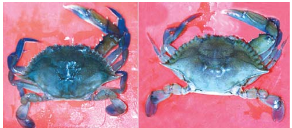
Fig.2 Jaiba blanda Callinectes arcuatus después de liberarse del viejo exoesqueleto